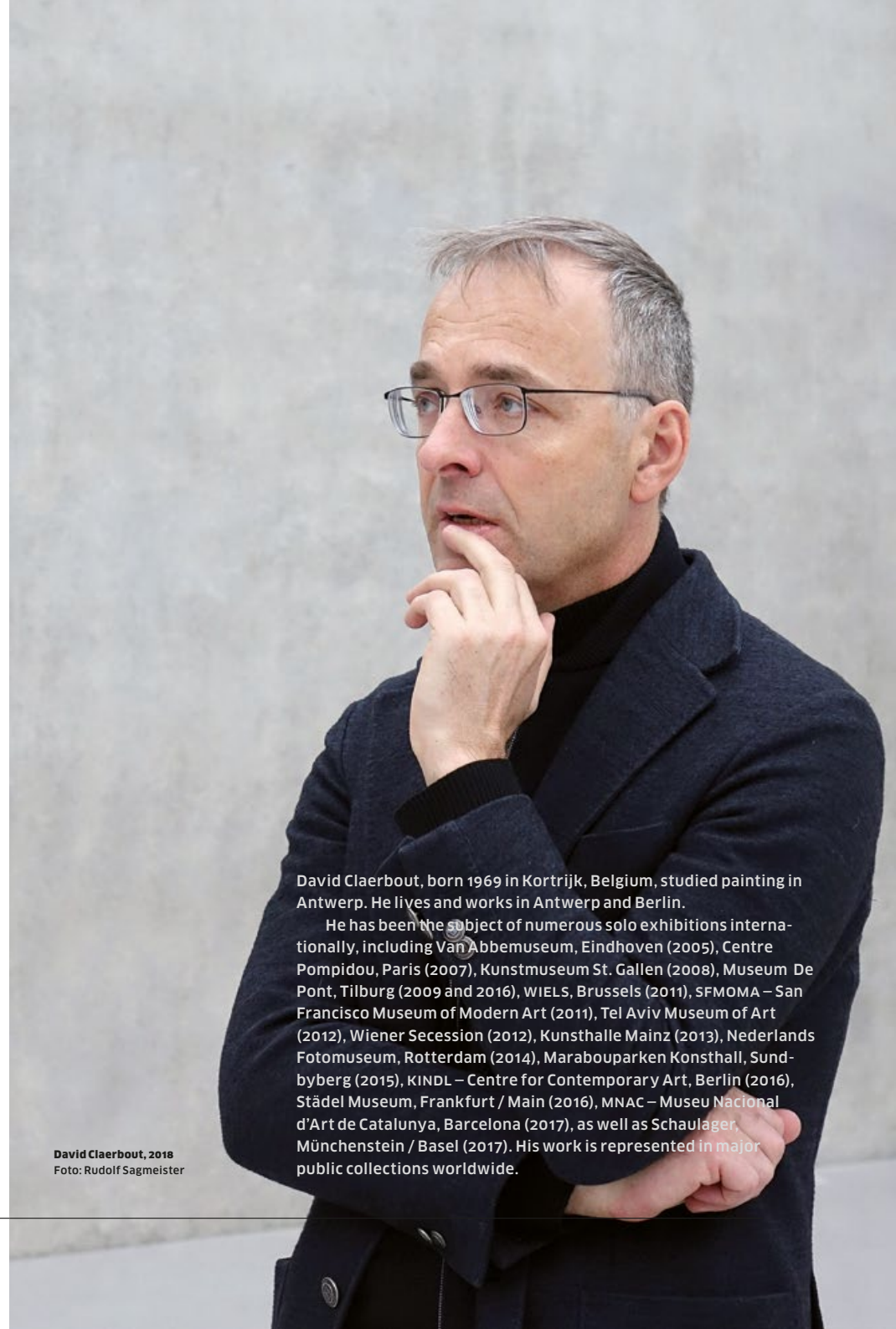
David Claerbout, 2018

Seine Werke wurden international in zahlreichen Einzelausstellungen präsentiert, unter anderem im Van Abbemuseum, Eindhoven (2005), Centre Pompidou, Paris (2007), Kunstmuseum St. Gallen (2008), Museum De Pont, Tilburg (2009 und 2016), WIELS, Brüssel (2011), SFMOMA – San Francisco Museum of Modern Art (2011), Tel Aviv Museum of Art (2012), Wiener Secession (2012), Kunsthalle Mainz (2013), Nederlands Fotomuseum, Rotterdam (2014), Marabouparken Konsthall, Sundbyberg (2015), KINDL – Zentrum für zeitgenössische Kunst, Berlin (2016), Städel Museum, Frankfurt am Main (2016), MNAC – Museu Nacional d'Art de Catalunya, Barcelona (2017), sowie im Schaulager, Münchenstein / Basel (2017). Sein Werk ist in wichtigen öffentlichen Sammlungen weltweit vertreten.