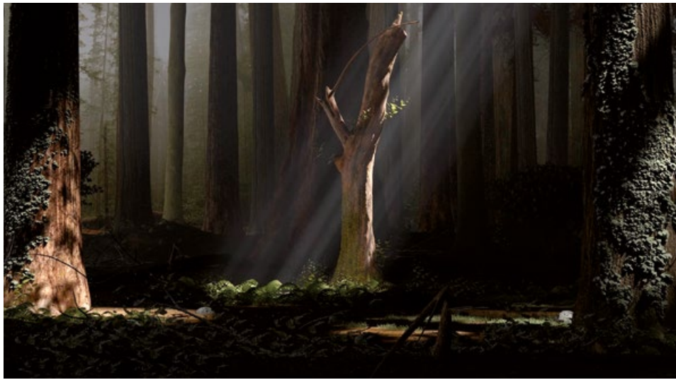
David Claerbout Travel , 1996 – 2013 Einkanal-Video, HD-Animation, Stereo-Sound, 12 Min., Videostill

A sequence of images fades into the soft ambient light of Peter Zumthor's famous building. Visitors coming into the entrance hall of the Kunsthhaus Bregenz face a large screen. The video work The Quiet Shore seems as if it were made for this place. David Claerbout's works require sensitivity to light and shading, distance and focus, rest and the passage of time. A coastal town in Brittany. It is low tide. The sea has retreated to a mirror-smooth surface in the distance. David Claerbout does not show a film, but a sequence of black-and-white images. It is a sequence without a plot. People can be seen from behind; they only observe, comparable to the protagonists in the films of Alfred Hitchcock, who occasionally stayed here. Their attention focuses, and the bathers interrupt their ball game. Some boys stand in the shallow water around a playmate. He powerfully beats both hands into the water so that it splashes around him in a crown. This is the moment on which all the pictures and faces focus. Each succession of events is due to adjacent events, and each perspective to a shifting within a single moment. Time is reduced to a single moment.