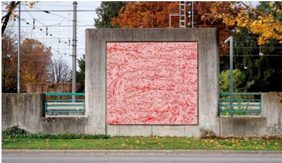
KUB Billboards an der Bregenzer Seestraße