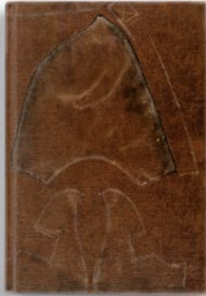
Symbolfoto | Illustration picture

KUB Online-Shop shop.kunsthhaus-bregenz.at