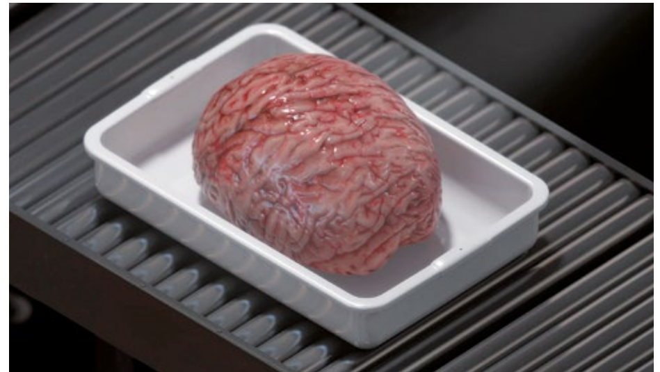
Ed Atkins Safe Conduct , 2016 Drei-Kanal- HD-Video mit 5.1-Surround- Sound, 9:05 Min., Loop, Videostill

Die Figuren in Atkins' Videoarbeiten erzählen Angst einflößende, prophetische Geschichten, die nicht nur von unserer Gegenwart handeln, sie lassen vielmehr die Zukunft im Kunsthaus Bregenz stattfinden – jetzt, in diesem Moment.