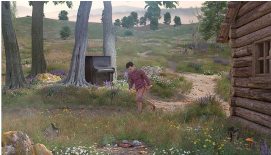
Ed Atkins Good Bread , 2017 Good Wine , 2017 HD-Video mit 4.1-Surround- Sound, 16 Min., Loop, Videostill Courtesy of the artist, Galerie Isabella Bortolozzi, Berlin, Cabinet Gallery, London, Gavin Brown's Enterprise, New York/Rom, und dépendance, Brüssel © Ed Atkins

Atkins' Arbeiten sind durchdrungen von Sentimentalität – Traurigkeit, Schönheit und Verwandlung wechseln sich im Tempo paranoider Gedanken ab. Einprägsame Bilder, vertraute musikalische Phrasen oder prägnante Appelle werden in letzter Minute geschnitten, ruiniert oder verweigert. Spuren tiefgreifender Zuneigung und unterbrochener Empathie hallen nach. Solche Empfindungen lassen Atkins' Arbeiten so eindrücklich wirken: Ein künstlicher Realismus und eine romantische Üppigkeit modellieren Gefühle, die sich im wirklichen Leben nur zu oft als unsagbar erweisen.