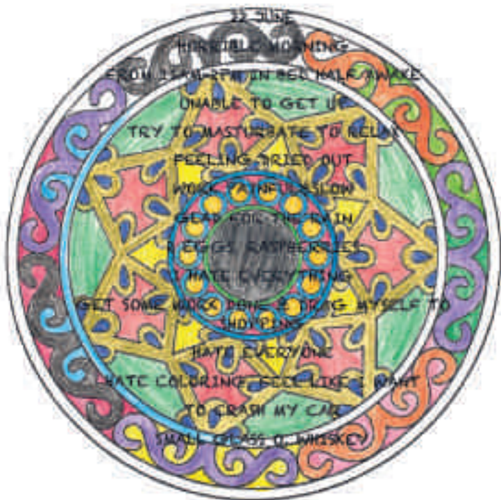
Anna-Sophie Berger 22nd June, 2015 Buntstift, Inkjet- Druck auf Papier

The perception of our »reality« has drastically changed, and with it the modes of its conceptualization.